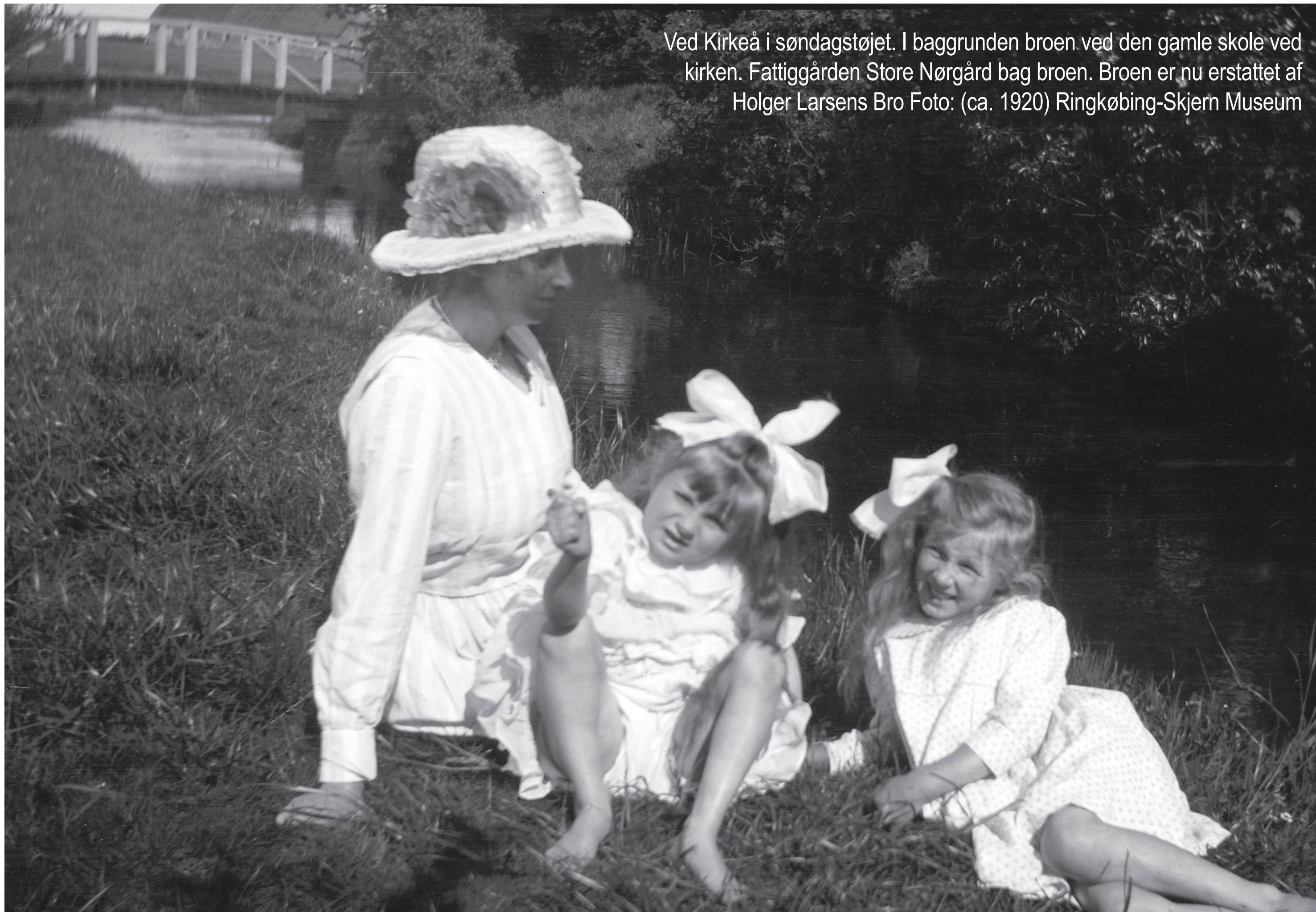
Ved Kirkeå i søndagstøjet. I baggrunden broen ved den gamle skole ved kirken. Fattiggården Store Nørgård bag broen. Broen er nu erstattet af Holger Larsens Bro Foto: (ca. 1920) Ringkøbing-Skjern Museum