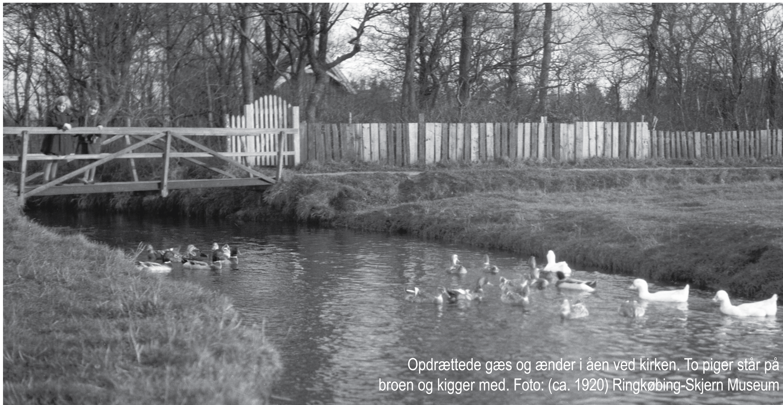
Opdrættede gæs og ænder i åen ved kirken. To piger står på broen og kigger med. Foto: (ca. 1920) Ringkøbing-Skjern Museum

Tilbage i tiden badede byens drenge og piger i åen, hver for sig, naturligvis. Det foregik vist nok ved fattiggården Store Nørgård. Selv en ældre kvindelig beboer fra fattiggården badede uden en trævli i åen. Da stationsbyen Skjern voksede omkring den nye jernbanestation, blev et par gode høller (huller) i Ganer Å brugt som badesteder. Igen med drenge og piger, der badede hver for sig og med alt tøj liggende på åbredden.